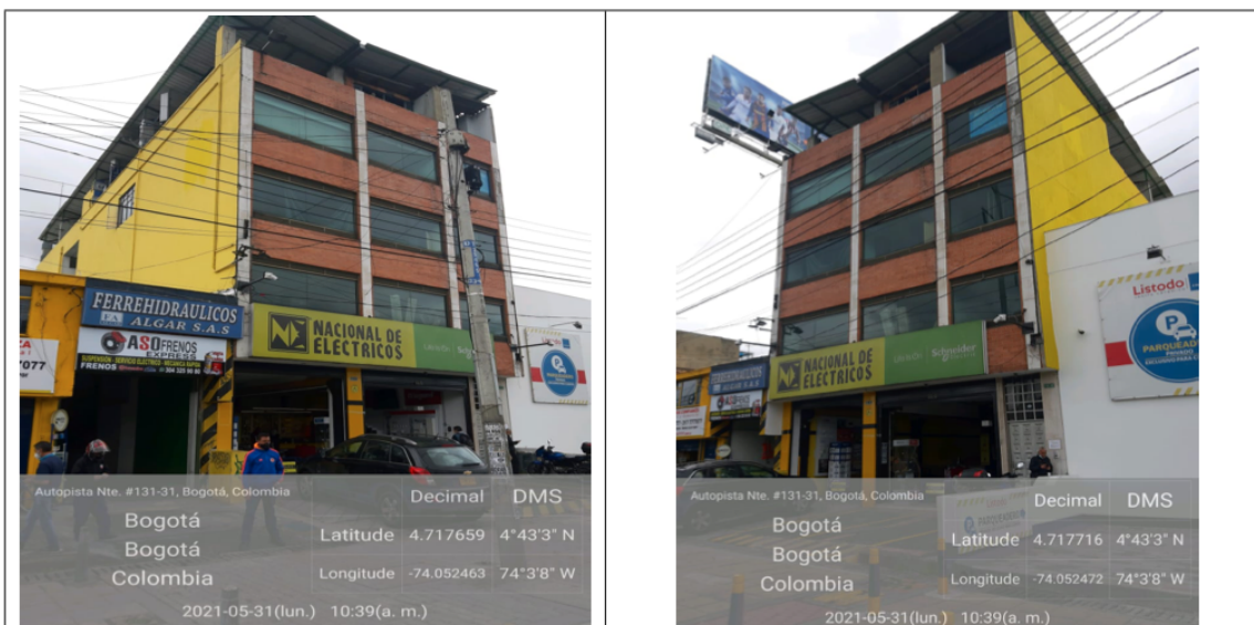
Foto panorámica del establecimiento 31/05/2021